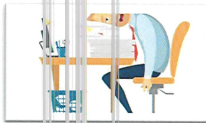
الأهمال في أداء العمل