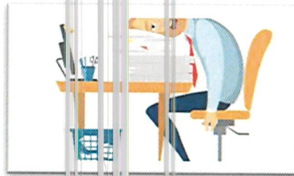
الأهمال في أداء العمل