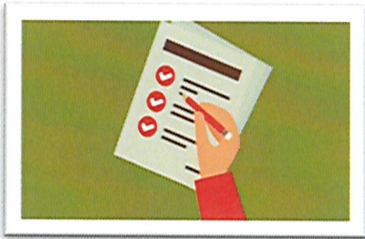
ترتيب وتنظيم خطوات العمل