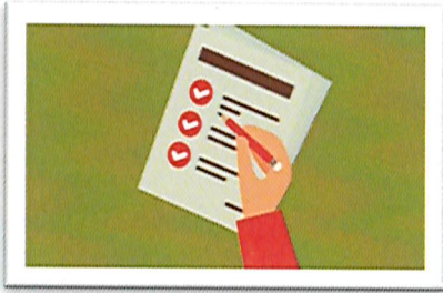
ترتيب وتنظيم خطوات العمل