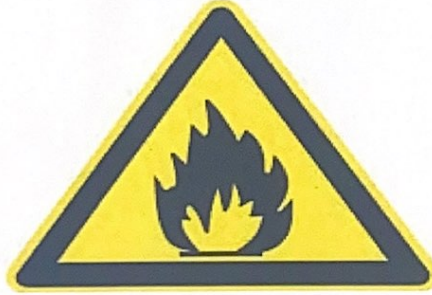
المواد القابلة للاشتعال